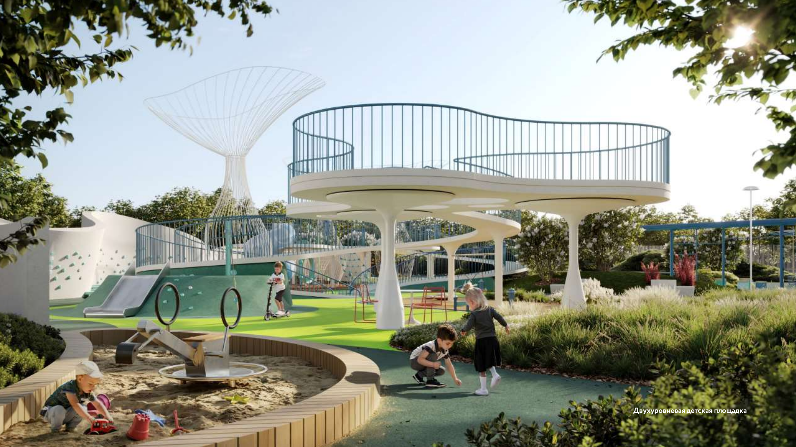
Двухуровневая детская площадка