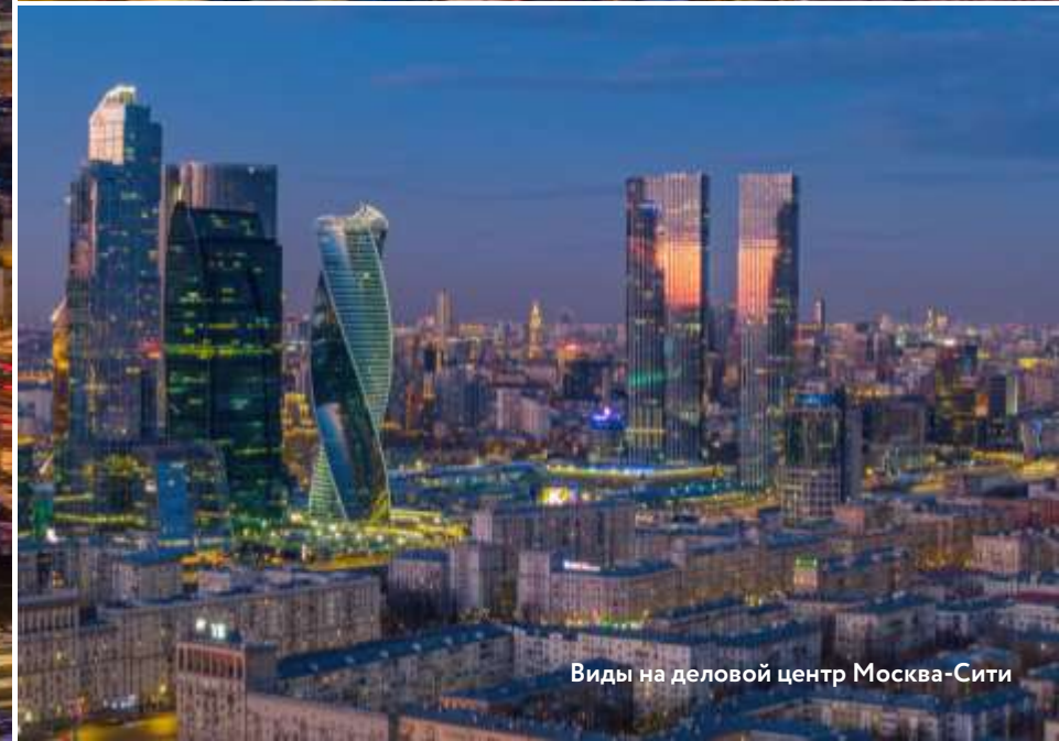
Виды на деловой центр Москва-Сити