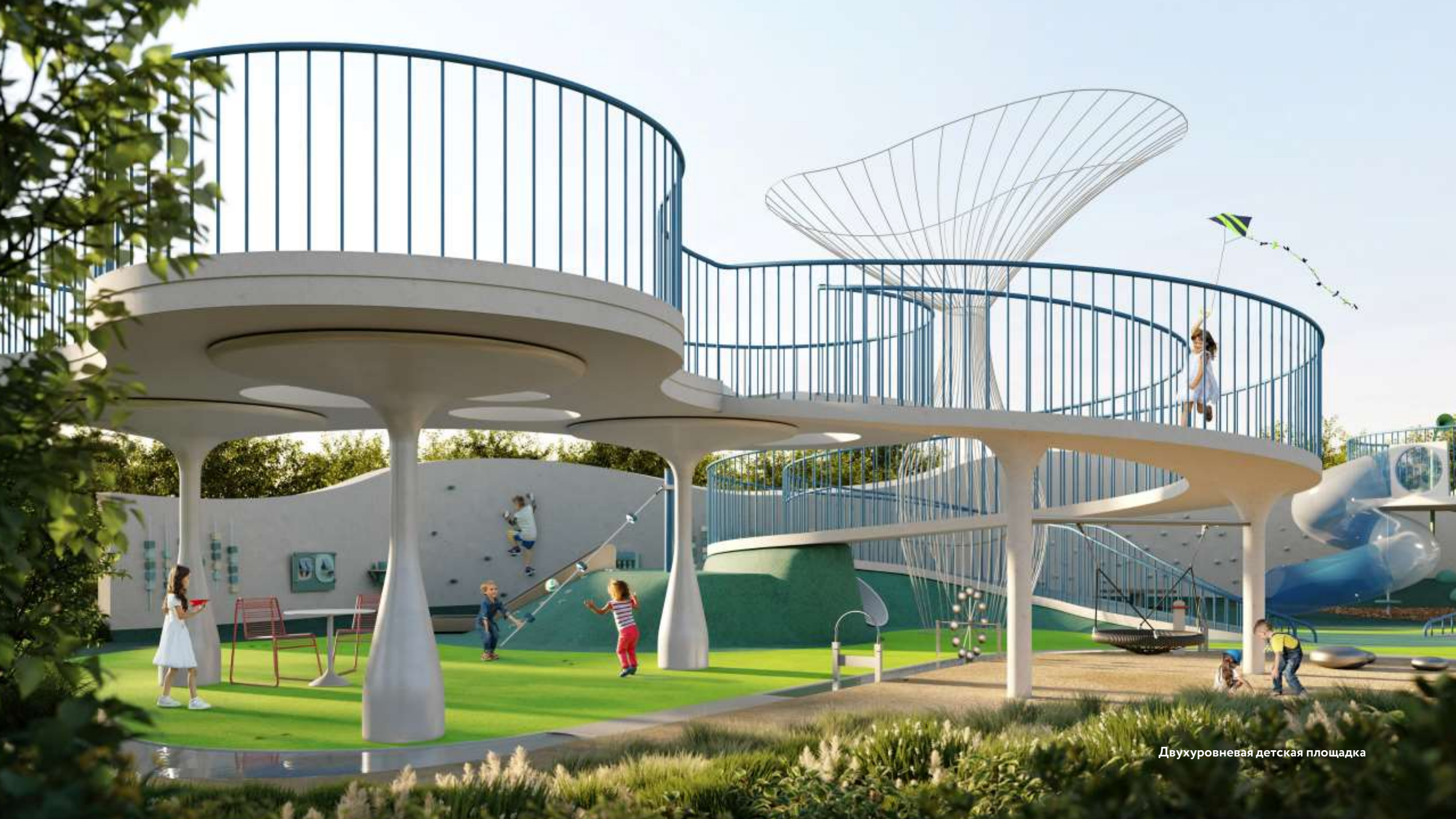
Двухуровневая детская площадка