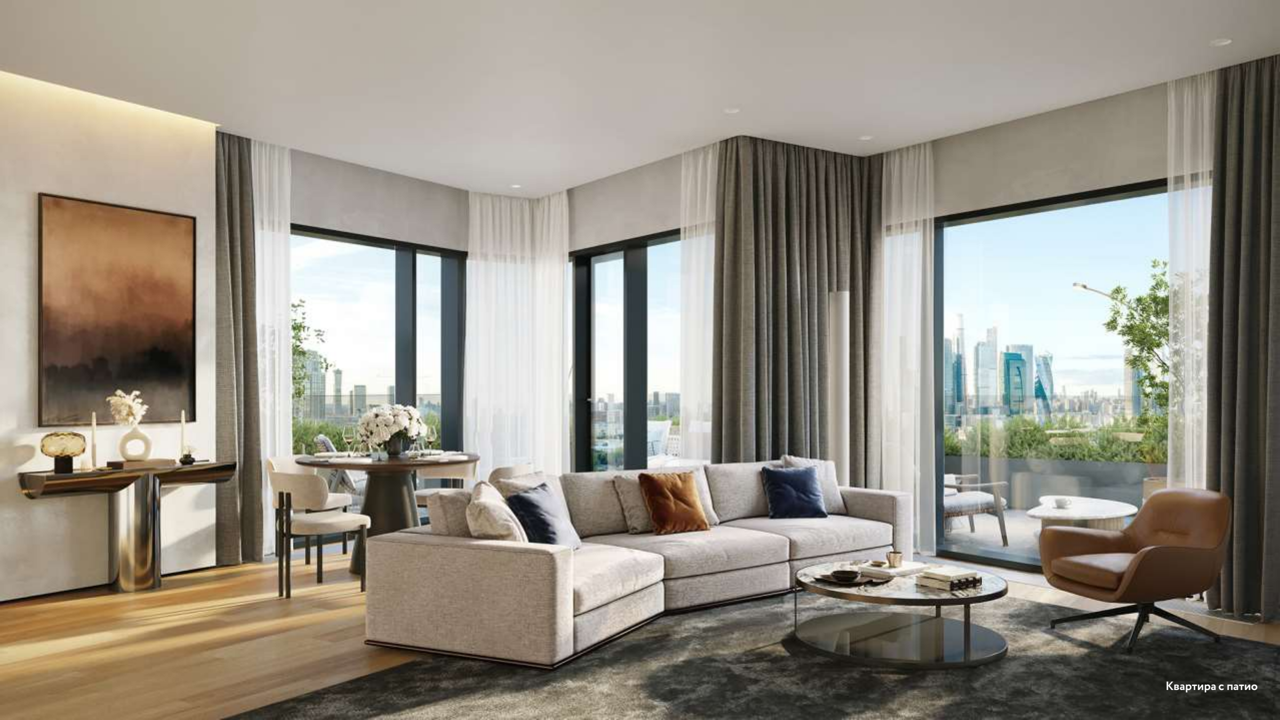
Квартира с патио