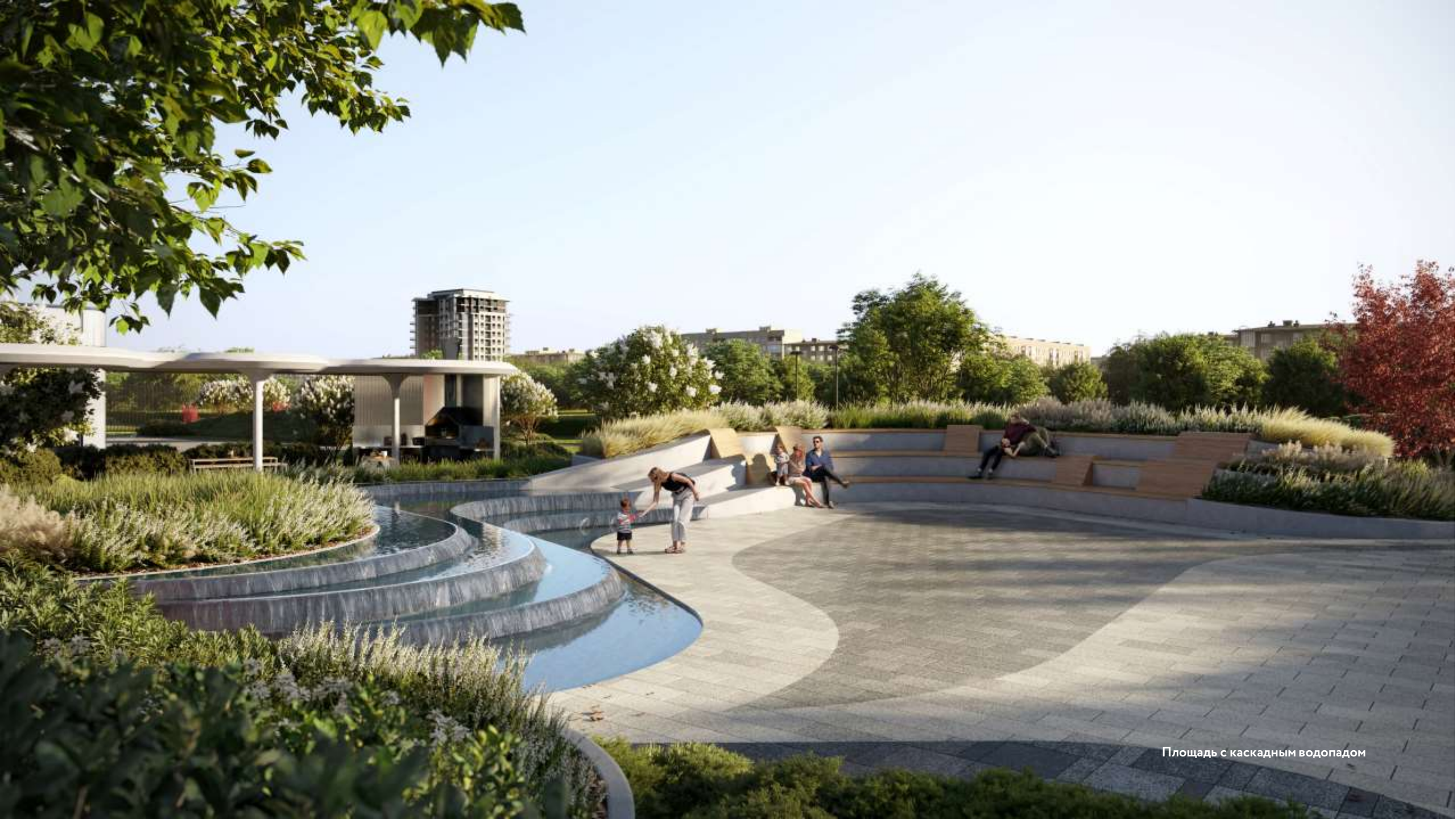
Площадь с каскадным водопадом