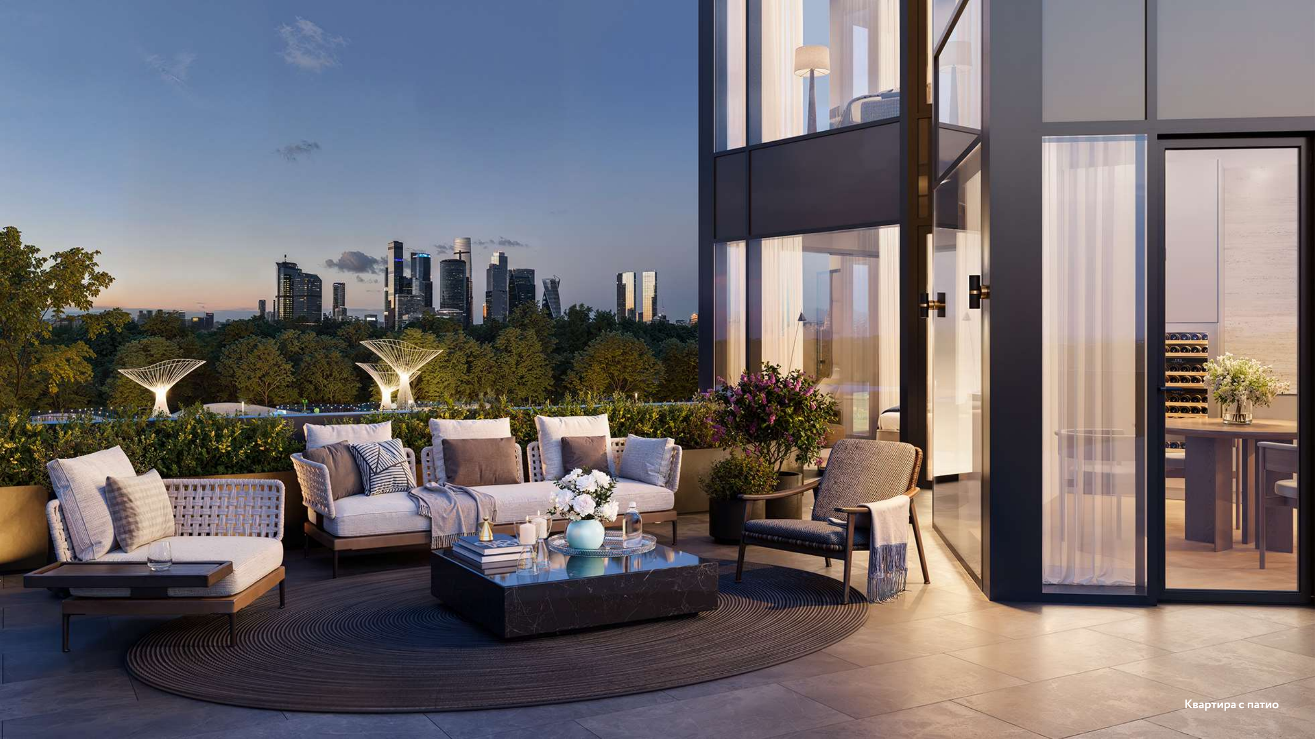
Квартира с патио