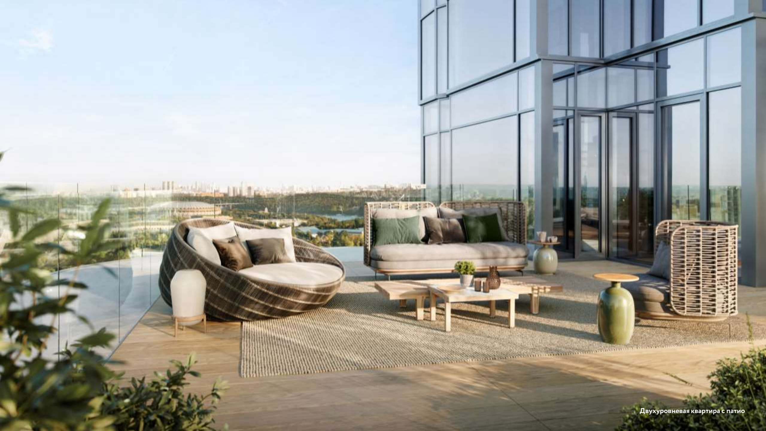
Двухуровневая квартира с патио