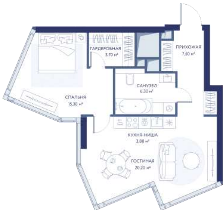
КВАРТИРА С 1 СПАЛЬНЕЙ