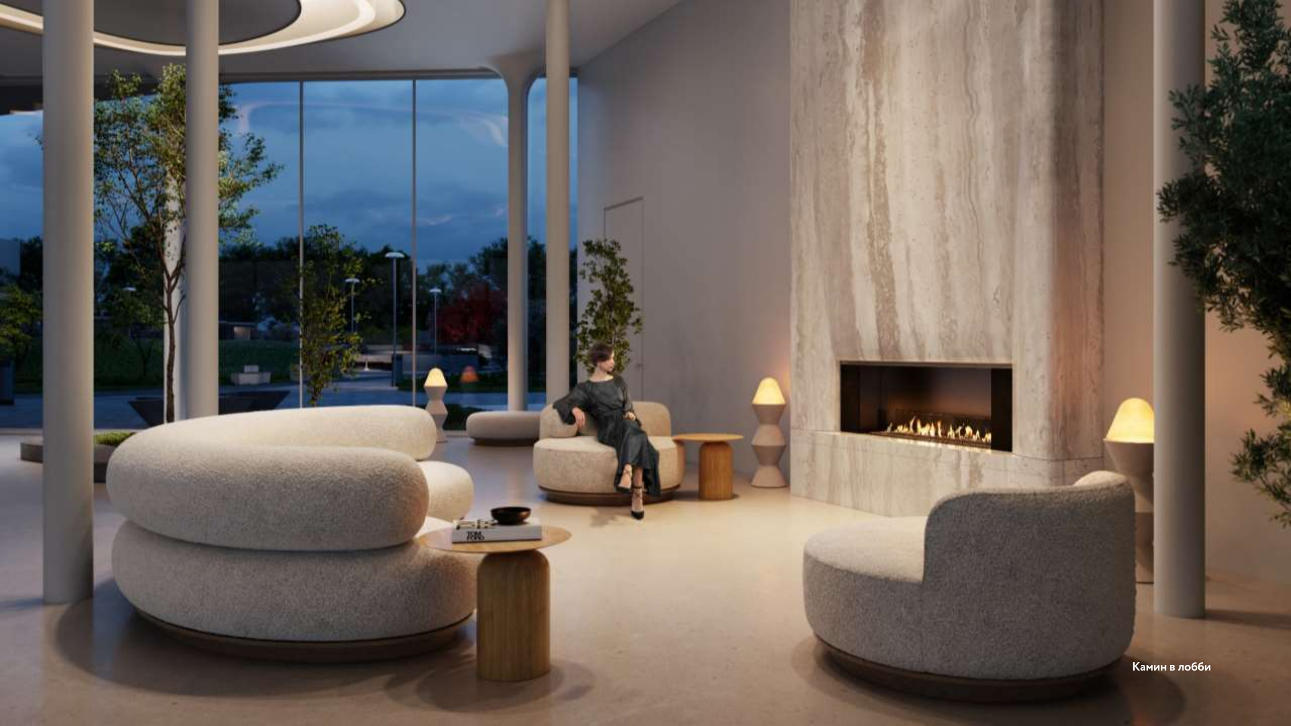
Камин в лобби