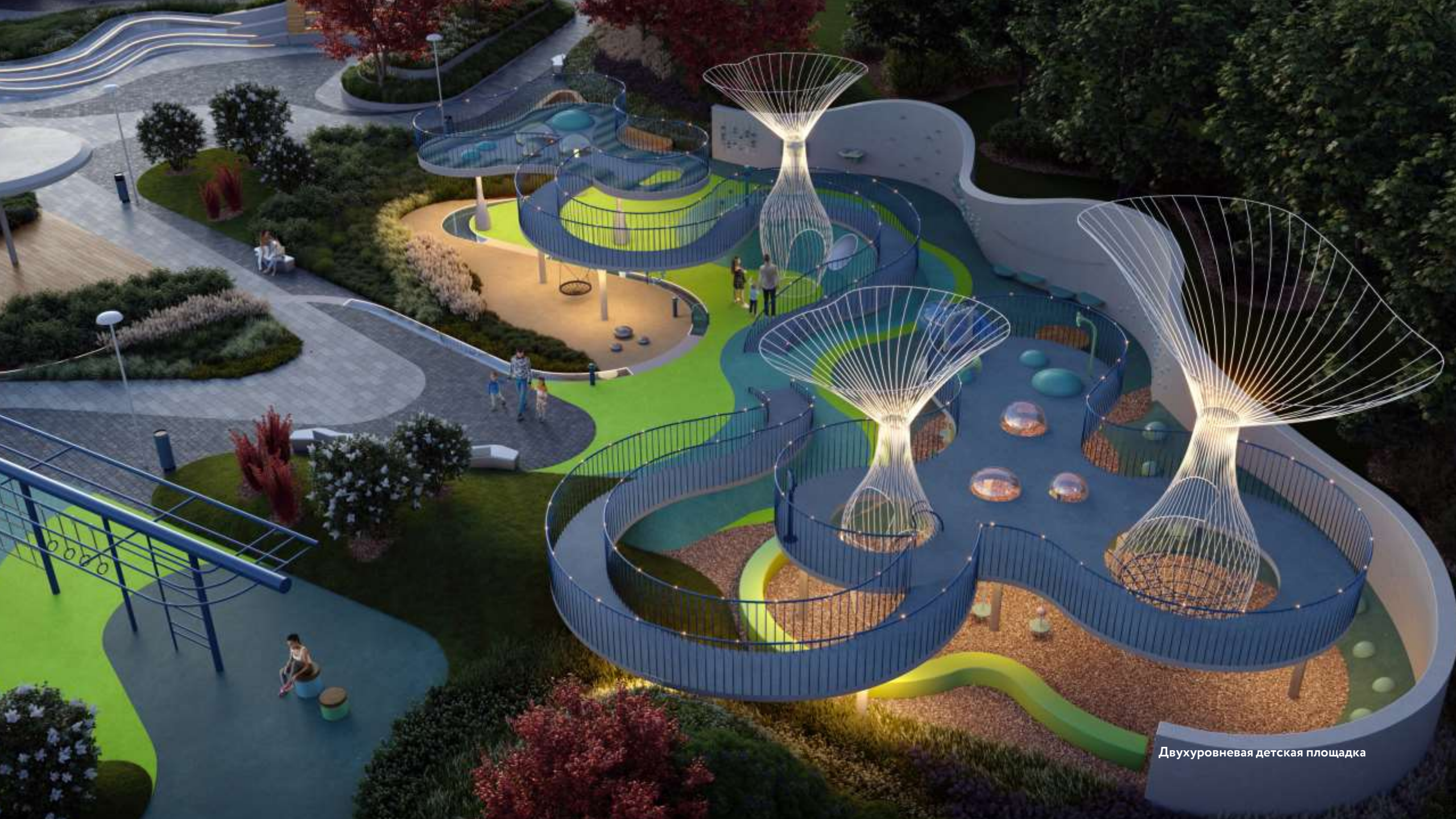
Двухуровневая детская площадка