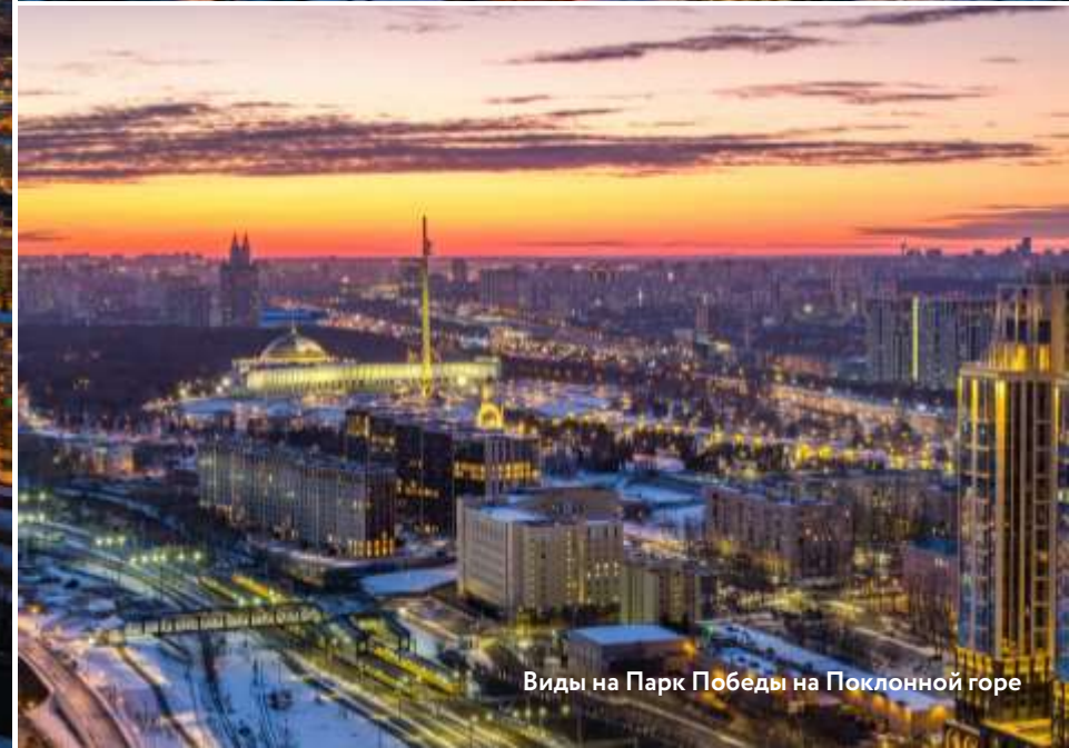
Виды на Парк Победы на Поклонной горе