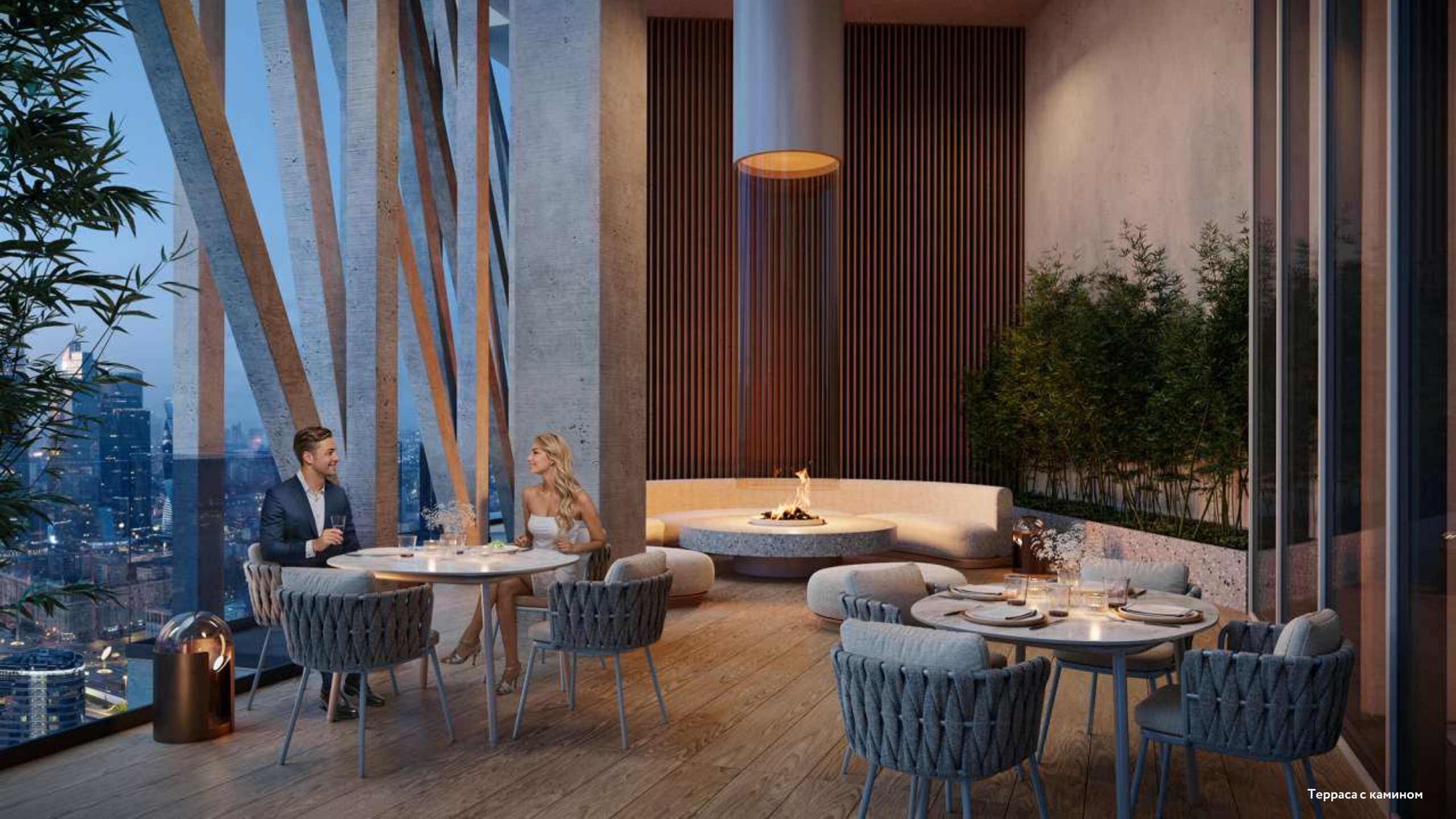
Терраса с камином