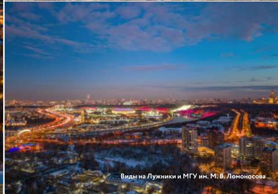
Виды на Лужники и МГУ им. М. В. Ломоносова