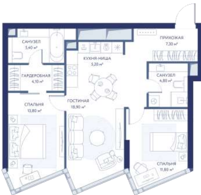
КВАРТИРА С 2 СПАЛЬНЯМИ