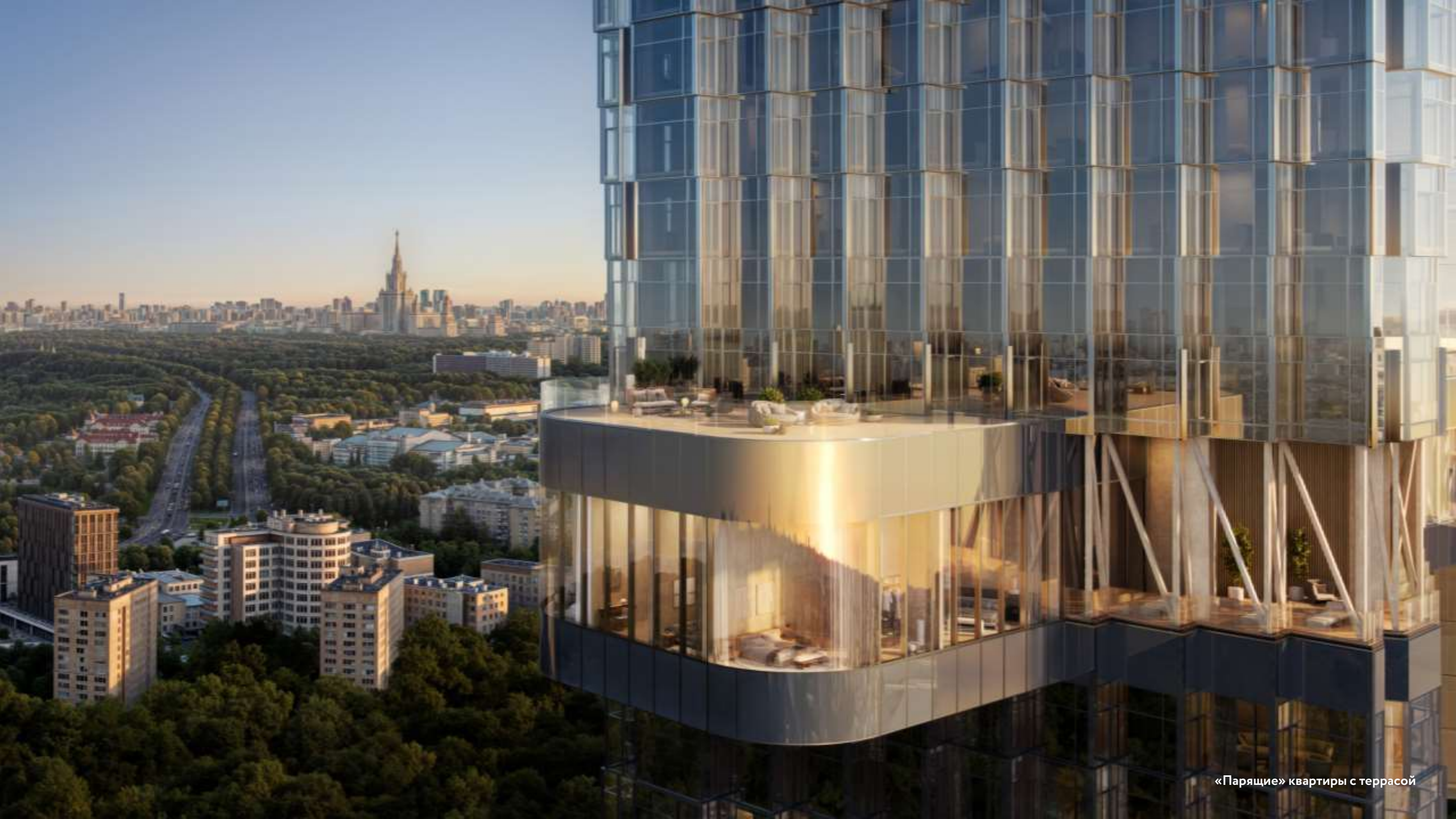
«Парящие» квартиры с террасой