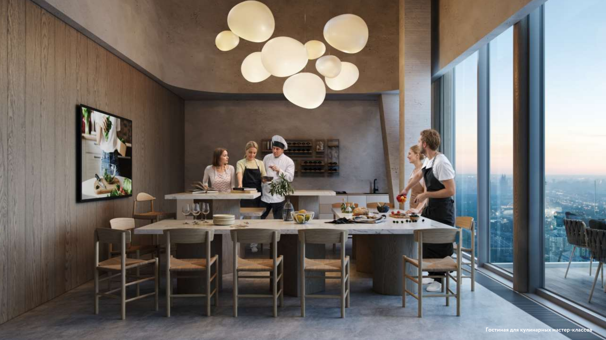
Гостиная для кулинарных мастер-классов