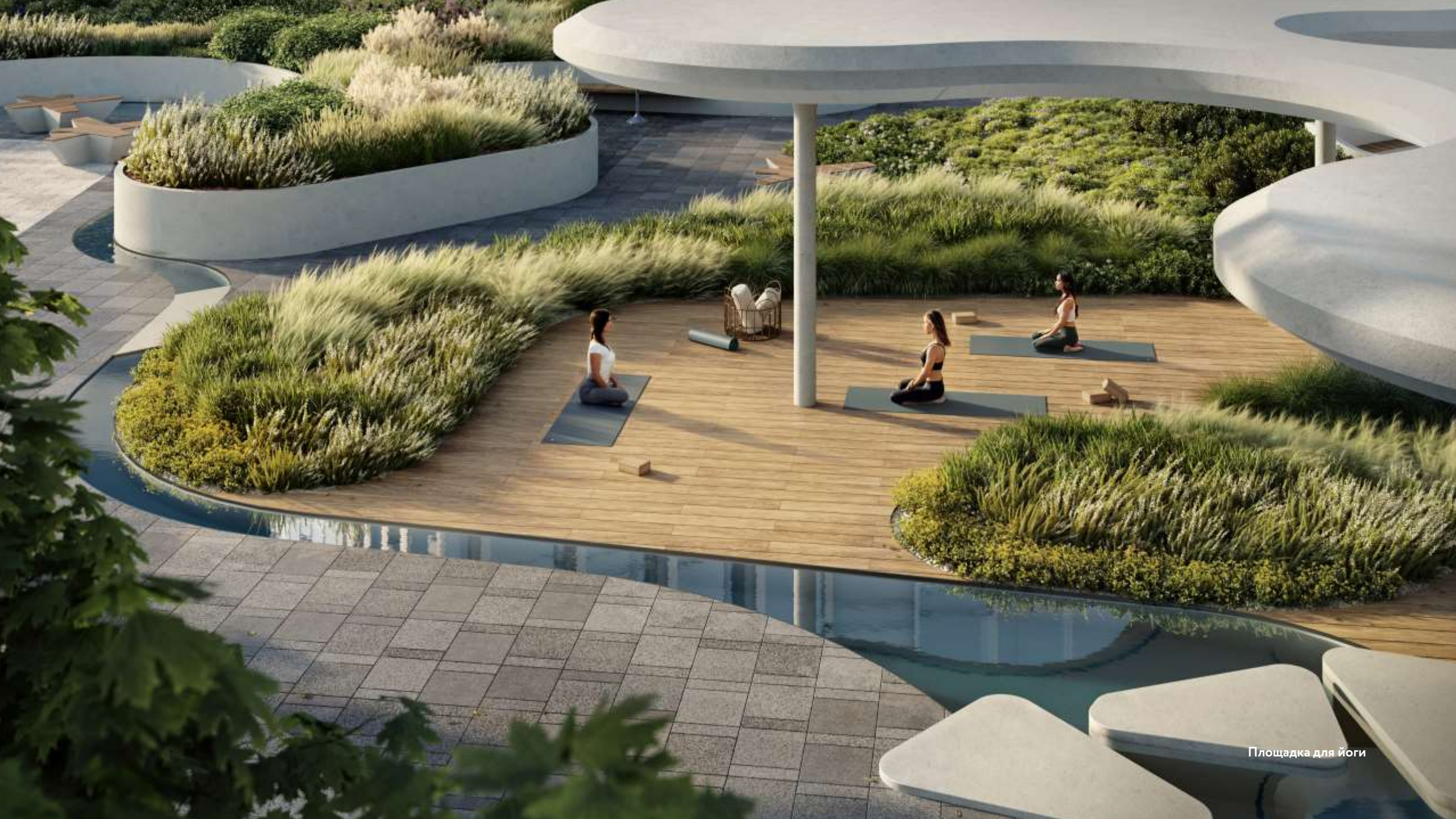
Площадка для йоги